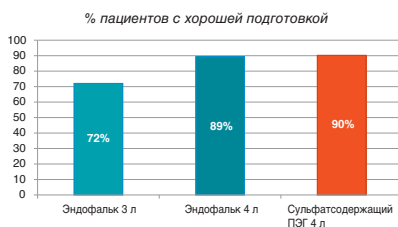
Эффективность различных схем подготовки кишечника: качество подготовки